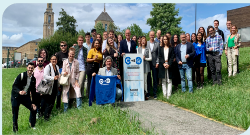
Charla de técnicos de Gijón Impulsa a 25 personas